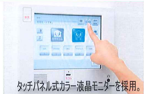
タッチパネル式カラー液晶モニターを採用。

これまでの防犯や防火を中心としたシステムであったホームセキュリティに、大切なデータを預かる機能、セコムグループ各社のサービスをご利用いただける機能など、暮らしに役立つ機能を付加した画期的なホームセキュリティシステムです。