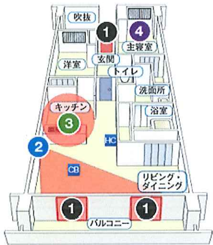
料金例(マンション 機器レンタルの場合の一例)